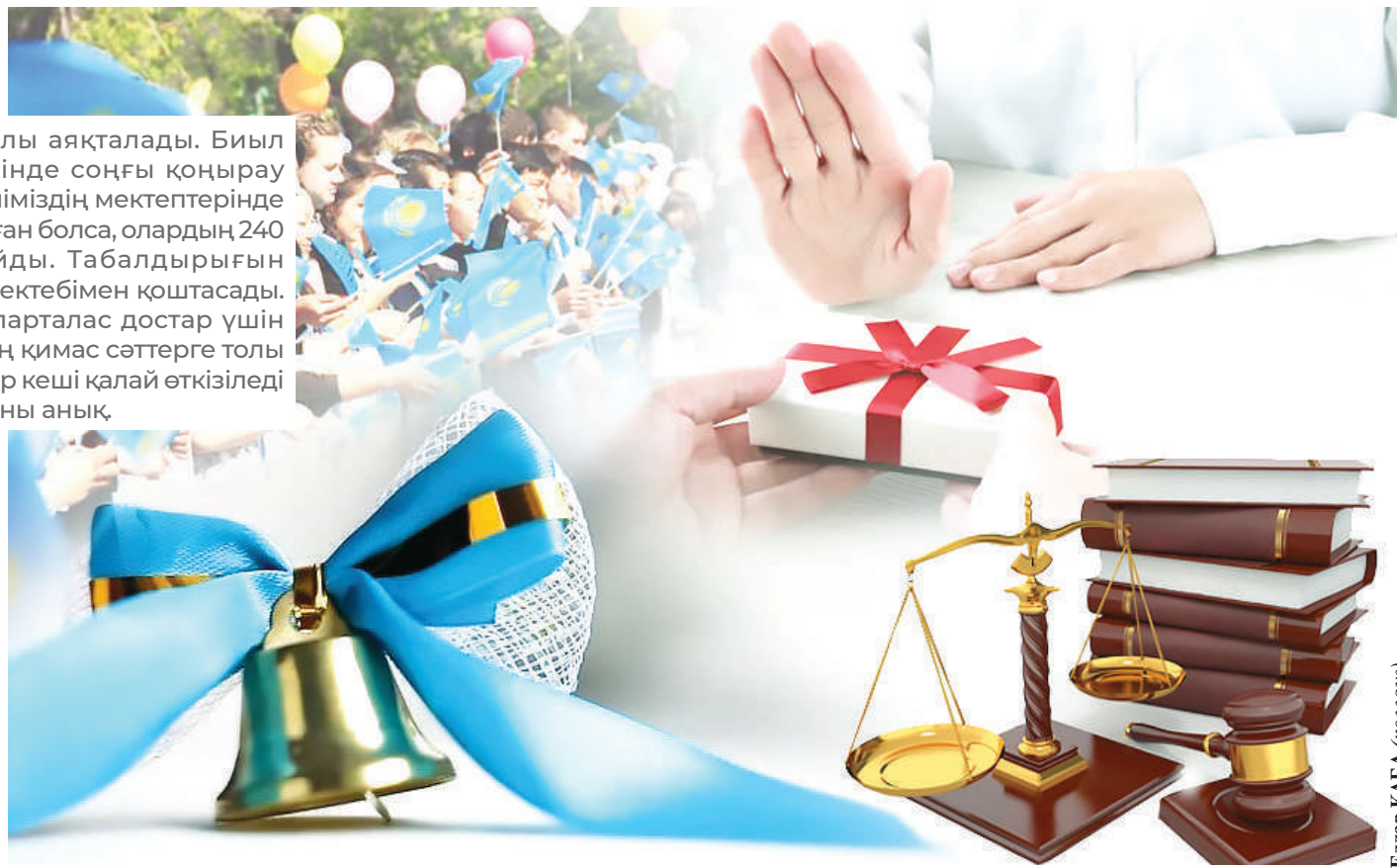
Елдар ҚАБА (солдан)