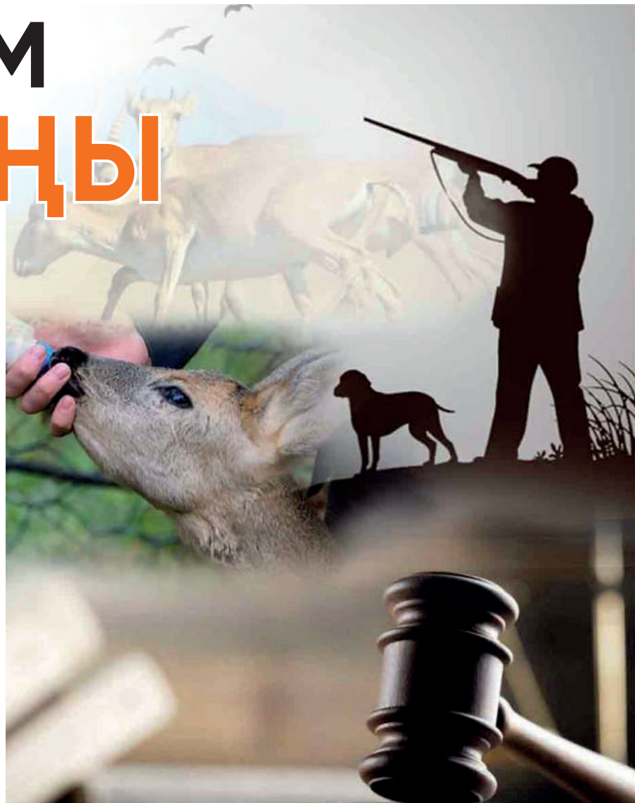
Елшір ҚАБА (қолжазба)

Ол әңгіме мектепті жаңа бітірген талапкерлерді қорықшыға оқыту туралы емес, іс басындағы қорықшының аңшылық бірлестіктерде қосымша оқыту туралы екенін нақтылады. Құрстарда қорықшыларға нақты міндеттерінде қажетті бағыттарда, мысалы, биология, экология, салалық заңнамалық база және жануарлар дүниесін қорғау әдістері бойынша білім берілімек.